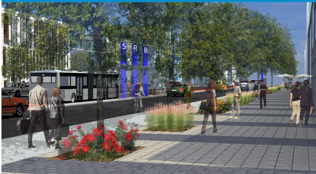
Perspective d'ambiance sur le boulevard Pie-IX à une station du SRB

Pour l'ensemble du corridor SRB, de Henri-Bourassa à Notre-Dame, c'est un peu plus de 470 arbres qui seront plantés, accompagné d'une amélioration notable du sentiment de sécurité et de confort tout le long de Pie-IX. L'amélioration significative du caractère urbain du boulevard résultant de cet important verdissement et du changement de mobilier urbain se traduiront par un tout nouveau Pie-IX.