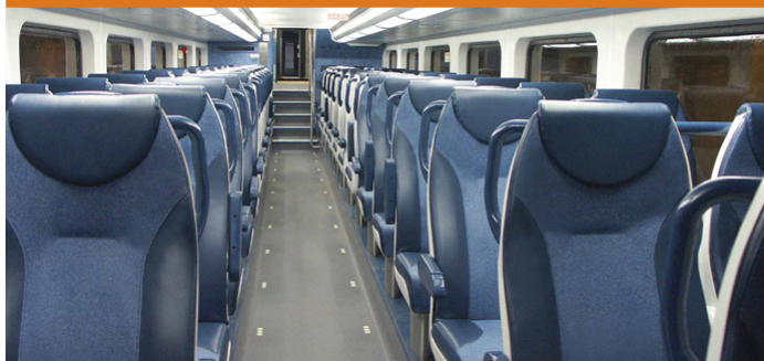
Intérieur des nouvelles voitures multi-niveaux